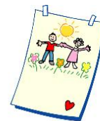
Días de los Abuelos 9 de Septiembre del 2007