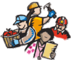
Día del Trabajo

Destruyendo el ganado y ovejas (animales del sacrificio), Satanás fue capaz de atacar a la familia de Job. Vamos a mantener el muro de protección sobre nuestras familias y determinarnos hacer lo que Job hizo. Debemos diariamente ofrecer sacrificios de oración a Dios por nuestras familias.